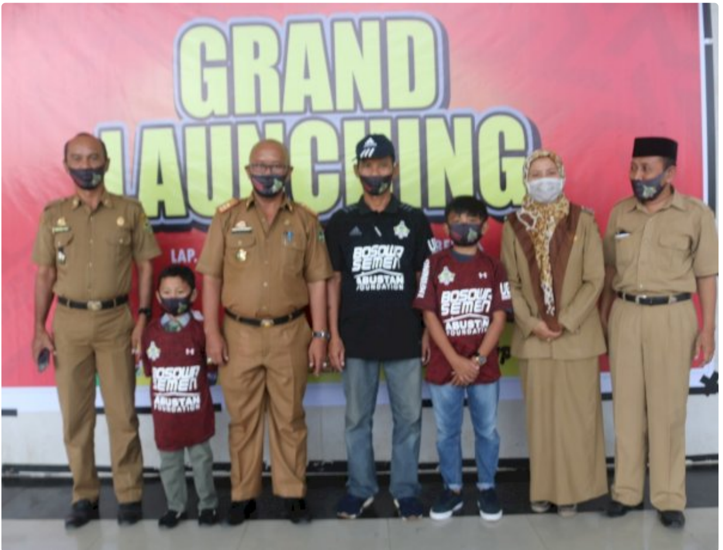
Pemkab Barru Apresiasi Sekolah Sepak Bola Hibrida

BARRU - Sekolah sepak bola (SSB) Hibridah Barru akhirnya resmi di launching, Senin (5/10/2020) sore, di tribun lapangan Sumpang Binangae Barru.