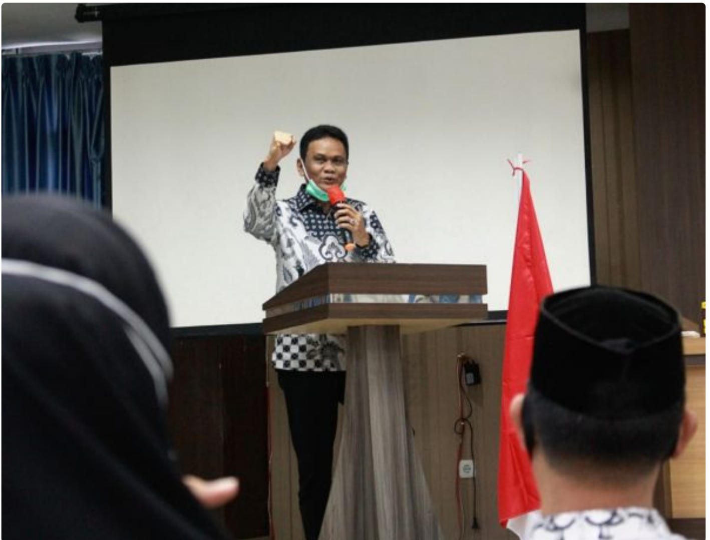
PGRI Barru Gelar Konferensi